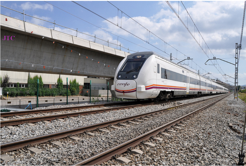
Imagen: JT Curses 2011